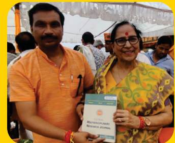
Inauguration of 6th edition by Suman Chaturvedi , Member of the Uttar Pradesh State Commission for Women.