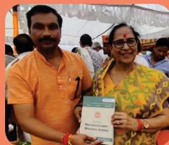
Inauguration of 6th edition by Suman Chaturvedi , Member of the Uttar Pradesh State Commission for Women.